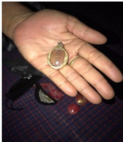
ภาพที่ 2 ไอ้ไข่ เครื่องรางนำโชคที่ครูแม่น้องพกติดตัวตลอดเวลา

ครูแม่น้องเล่นการพนันหวยเพียงประเภทเดียว แต่ทว่าด้วยความที่เป็นคอหวยตัวโยง ครูน้องจึงมีความรู้เรื่องหวยออนไลน์เป็นอย่างดี “แม่เล่นการพนันหวยอย่างเดียว เล่นทุกม้อ ซื้อในเว็บ มี 3 นอย พุ้นเด้อ เดี่ยวนิ ซื้อในเว็บกะบ่ได้ซื้อหลาย ซื้อ 5 บาท เฮากะได้ 450 แล้ว นอยพิเศษ นอยปกติ นอย VIP ม้อได้ลาวกะ เล่นลาว พอได้ค่ากับข้าว 10 บาทกะ 900 น้อ บ่ได้ซื้อหลาย 5 บาท 10 บาท ม้อนี้กะได้ 10 บาท บ่ได้ซื้อหลาย 5 บาท 10 บาท” เมื่อถามถึงสิ่งศักดิ์สิทธิ์ ครูแม่น้องเล่าว่า “ไหว้บูชายุ่งตะละ บูชาสิ่งศักดิ์สิทธิ์ แม่บูชาไอ้ไข่ ม้อเข้ากะว่าสิไปซื้อหุ่นกับชุดทหารมาให้เพ็ด ว่าให้หมา น ๆ สิซื้อหุ่นเด็กน้อยผู้ชายกับชุดทหารมาให้ใส่ ศาลกะมีหน้าเฮือน มันบ่ได้เอาใส่ทุกม้อดอก ไอ้ไข่เพ็ดมักทหารเด่ ม้อนั้น ซ้อธมาหาให้เพ็ด ได้เว้านำเพ็ดว่าให้หมา นว่าสิไปเอาชุดทหารมาให้ สิไปหามาให้เพ็ดดี มันได้เว้าไว้ ก่อนสิตั้งศาล กะได้หน้าเอา หน้าเอา จนว่าจะเอาเฮือนมาให้กะได้เอามาอ้อหลี เอามานำครูน่ากัน อยู่หน้าศูนย์ (ที่ทำงาน) หมานกะเอาค่าหมากค่าฟูไปถวาย แม่เอาไปถวายเกือบสิม้อ เฮาเหลียวบ่เห็น กะสิมาช้อยเฮา มันมีเซ็นเต้ ก่อนที่ท้อบ้านกะบอกอยู่ว่าถ้าหมา นสิเอาบ้านมาให้ กะต้องเว้าแล้วต้องรักษาสัจจะ นำแนวมนี่ อย่าไปเว้ามะล้ามะลอยบเฮ็ดได้ ถ้าว่าสิให้หยังกะต้องให้”