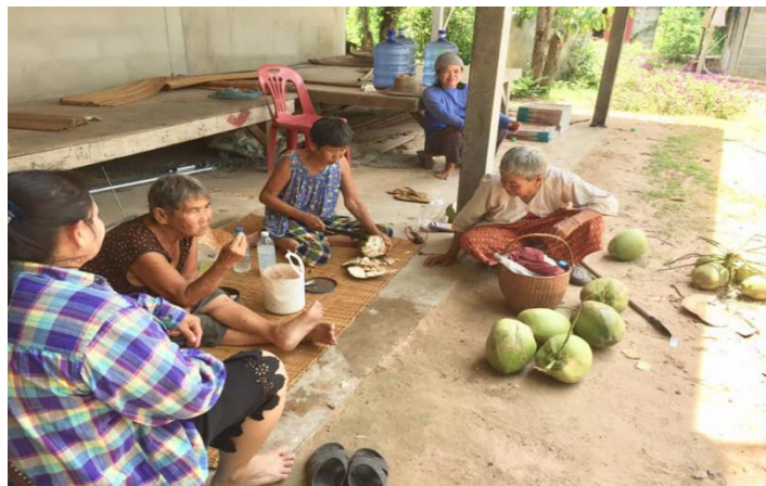
ภาพที่ 4 บรรยากาศการสัมภาษณ์ผู้สูงอายุ อำเภอเชิงใน

ความเชื่อในสิ่งเร้นลับหรือพลังที่มองไม่เห็น เป็นเงื่อนไขหนึ่งที่ทำให้กลุ่มผู้สูงอายุเมื่อไม่ประสบความสำเร็จในการขอหวย ก็จะมีแนวโน้มที่ “ดวง” หรือ “โชค” ของตนเอง ผู้สูงอายุจากอำเภอเชิงในเชื่อว่า “การที่ไม่มีโชค เพราะดวงชะตา หากดวงชะตาเปิดทางรวยก็จะทำให้ถูกหวย หรืออาจจะเรียกได้ว่ายังไม่มีดวง ในการซื้อหวยครั้งนั้นๆ หากดวงยังไม่ได้ ไม่มีโชคก็จะทำบุญ แต่จะไม่บนบาน เน้นการทำบุญเสริมดวง หรือพิธีสะเดาะเคราะห์ (แต่งปลัด แต่งแก้) เพื่อเสริมบารมี และเสริมดวง” สอดคล้องกับผู้สูงอายุจากอำเภอน้ำยืนที่เห็นว่าการเล่นหวยแล้วไม่ถูกเกิดจาก “เพราะว่าดวงเราไม่มี ดวงเราตก ดวงเราไม่ขึ้น (แล้วจะเล่นไปเรื่อยๆ ไหม?) ถ้าไม่มีโชคก็ต้องถอย เพราะมันไม่มีโชค ถ้ามีโชคมันไม่ยากเลย ไม่น่าจะถูกมันก็ถูก”