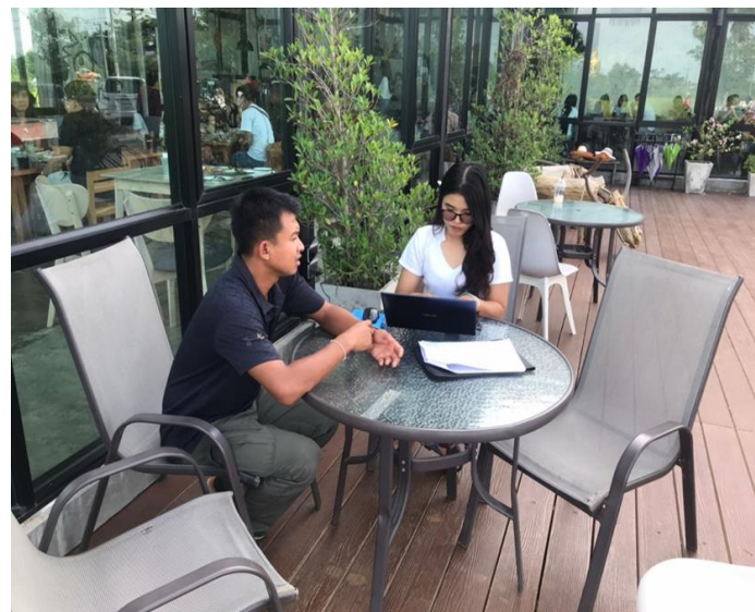
ภาพที่ 8 บรรยากาศการสัมภาษณ์กลุ่มมนุษย์เงินเดือน