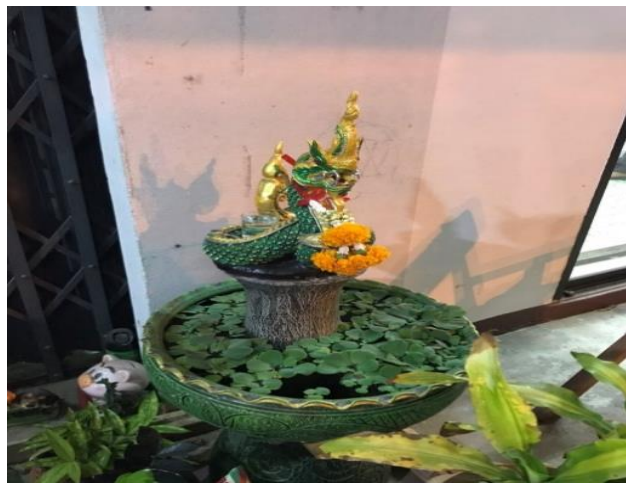
ภาพที่ 1 การบูชาพญานาคหน้าบ้านของรุ่ง

นอกจากนี้ ปัจจัยเรื่องข้อจำกัดด้านการเงินทำให้รุ่งตัดสินใจเล่นการพนัน รุ่งกล่าวว่า “เขามีรายได้ น้อย การที่เขาซื้อหวย เฮ็ดให้เขามีรายได้เข้ามาเพิ่มมากขึ้น มันอาจจะไม่ได้ตลอดกะจริง แต่กะพอให้มีรายได้ เพิ่มขึ้น ช่วยได้เยอะเลยกะว่าได้” รุ่งเคยประสบความสำเร็จจากการซื้อหวยโดยถูกรางวัลข้างเคียงได้เงิน จำนวนกว่า 2 แสนบาท