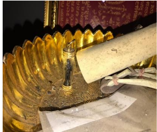
ภาพที่ 3 โต๊ะบูชาไอ้ไข่ที่บ้านครูแม่น้อง