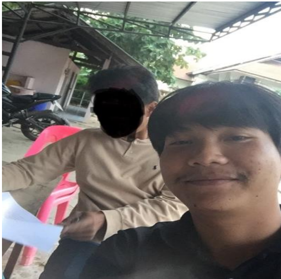
ภาพที่ 6 สัมภาษณ์เยาวชนอำเภอศรีเมืองใหม่

ในกลุ่มเยาวชนที่สัมภาษณ์เคยมีประสบการณ์การเล่นพนันออนไลน์ ทั้งการพนันฟุตบอล และบาคาร่า อย่างไรก็ตามข้อมูลจากการสัมภาษณ์พบว่าบางคนเลิกเล่นพนันออนไลน์แล้ว เพราะเคยถูกโกง เล่นได้แล้วไม่โอนเงินให้ อีกสาเหตุหนึ่งคือยิ่งเล่นยิ่งเสียจึงเลิกเล่น ขณะที่ความเสี่ยงก็เป็นประเด็นที่ทำให้ตัดสินใจเลิกเล่นพนันออนไลน์ ดังที่เยาวชนผู้ให้ข้อมูลได้บอกเล่าว่า “เลิกเล่นแล้ว ตอนเล่นๆ คนเดียว มีได้มีเสีย เสียก็ไม่เล่นต่อเพราะว่ากลัวจ่ายเยอะ เพราะความเสี่ยงสูงในการเล่น ในเว็บโกงง่าย เว็บไหนว่าไม่โกงไม่มี เหมือนเล่น 20 บาทได้เงินห้าเต็มพันเยอะ เลยทำให้คนเล่นทุ่มเงินลงไปเยอะ อย่างน้องคนรู้จักเล่นได้หลายล้าน ค่าโกงปิดเว็บไปเลย”