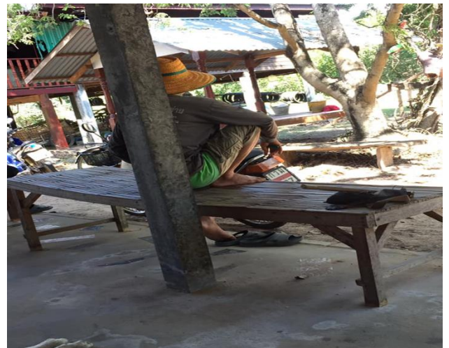
ภาพที่ 5 การสัมภาษณ์กลุ่มผู้ให้ข้อมูล อำเภอสำโรงและอำเภอเชียงโน

ในส่วนที่ไม่ประสบความสำเร็จในการขอพรจากสิ่งศักดิ์สิทธิ์หรือสิ่งเร้นลับ พบว่ากลุ่มชาวบ้านอายุ 26-59 ปี มีความคิดเห็นคล้ายคลึงกับกลุ่มผู้สูงอายุ กล่าวคือเมื่อไม่ประสบความสำเร็จหรือไม่ถูกหวยจากการขอพรจากสิ่งศักดิ์สิทธิ์พวกเขามองว่าเป็นเพราะ “ดวง” ของพวกเขาเองที่ทำให้ไม่มีโชค ดังข้อมูลของชาวบ้านจากอำเภอน้ำยั้น ที่พิจารณาว่าการที่ตนเองขอพรจากสิ่งศักดิ์สิทธิ์แล้วไม่สำเร็จเป็นเพราะ “ความเชื่อในเรื่องพวกนี้ มีมากเลยแหละ ถ้าได้เลขมาแล้วเราไม่ถูกก็แสดงว่าเราไม่มีดวง แต่ท่านก็ให้จริงๆ แม่นยำ คิดว่าที่ไม่มีโชค