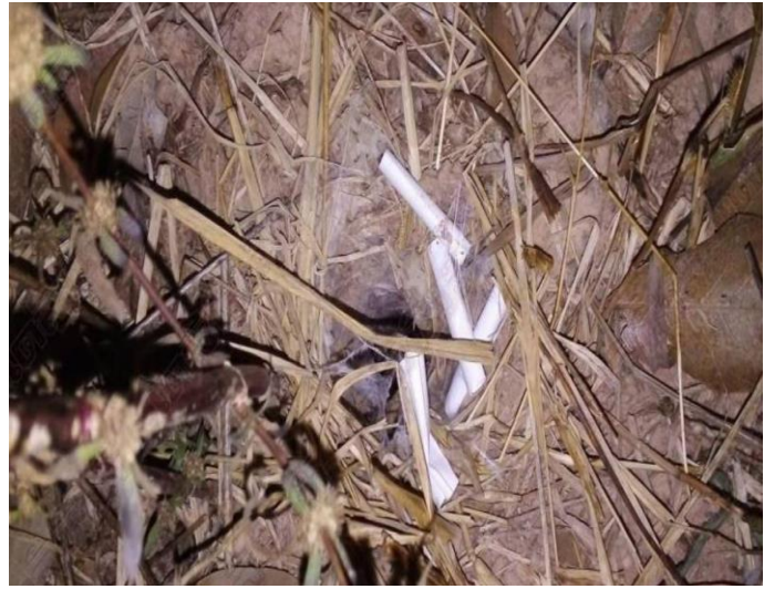
ภาพจาก: เดลินิวส์, “มาแล้วงวดนี้! โพลีให้เห็นกันจะจะเลขเด็ดจาก “พญาบั้ง”

https://www.dailynews.co.th/regional/815748