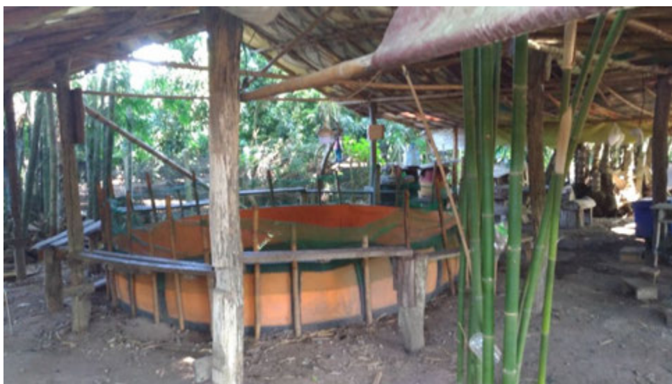
ส่งเวียนซ่อมไถ่