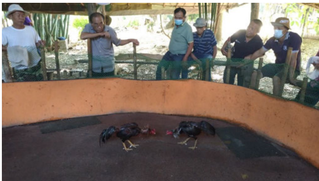
มาตรการระยะห่างในการเชียร์การชนไก่