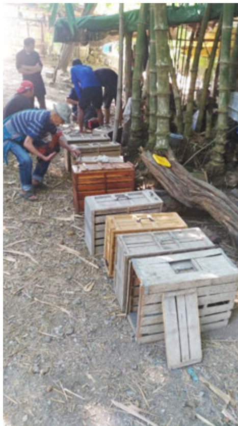
ส่งใส่ไถ่นำเข้าสนาม