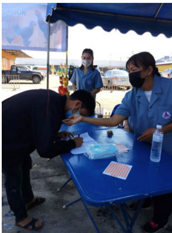
มาตรการป้องกันก่อนเข้าสนามชนไก่