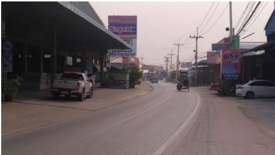
ภาพเส้นทางเข้า-ออกกลางหมู่บ้าน