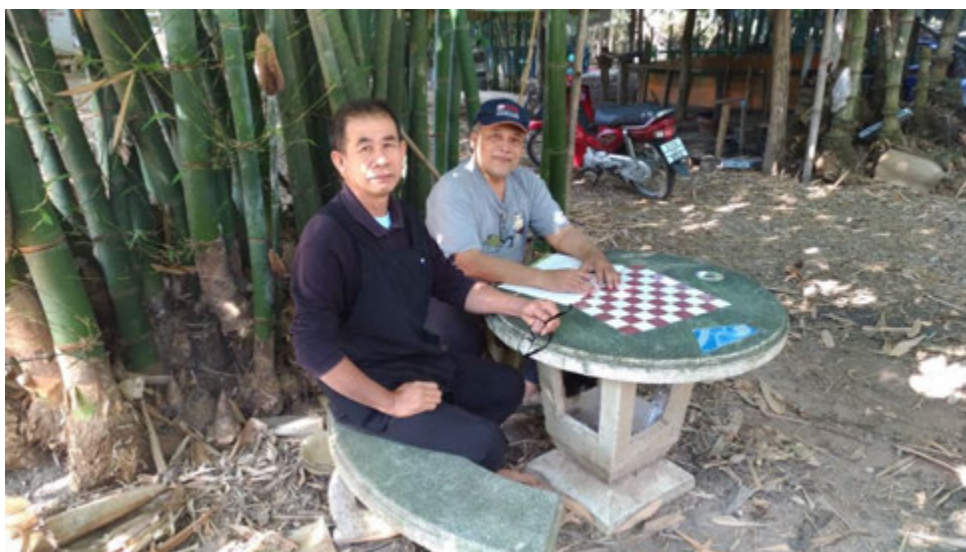
การเก็บข้อมูลภาคสนาม