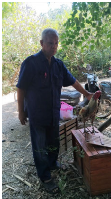
ภาพผู้สูงอายุกับไก่ชน