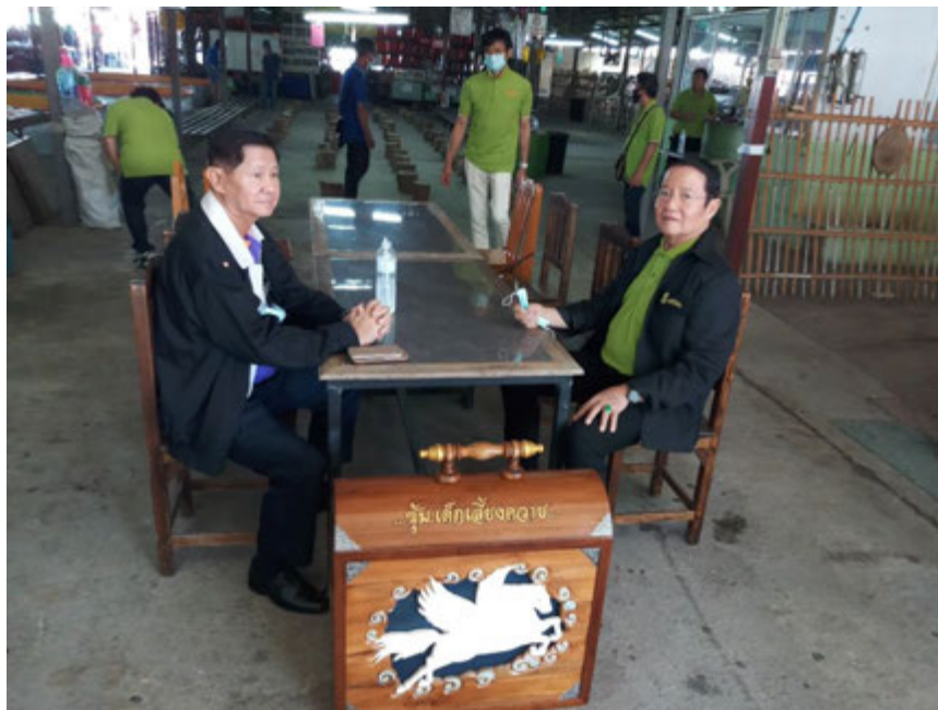
พลตรีอินรัตน์ (เสธม่วย) กับพลเอกบัณฑิต มาเยี่ยมสนามชนไก่บ้านม้า