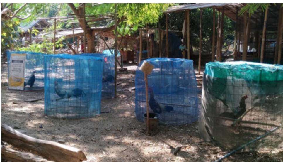
จุดเศรษฐกิจการค้าขายไก่ชน