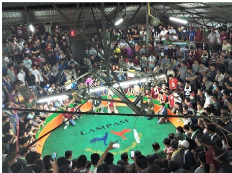
สังเวียนไก่ชนหลักแสดงถึงความแออัดของเขียนพนันไก่ชน เสี่ยงต่อการแพร่ระบาดเชื้อไวรัสโควิด-19