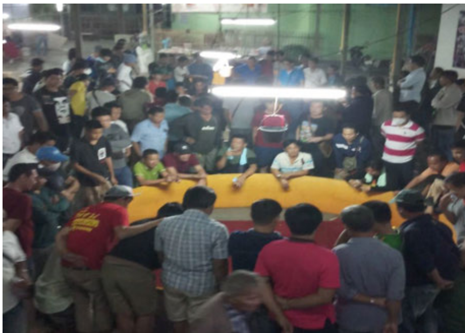
สังเวียนรอง จะไม่มีที่นั่งตามระเบียบสนามชนไก่ออกโดยกระทรวงมหาดไทย