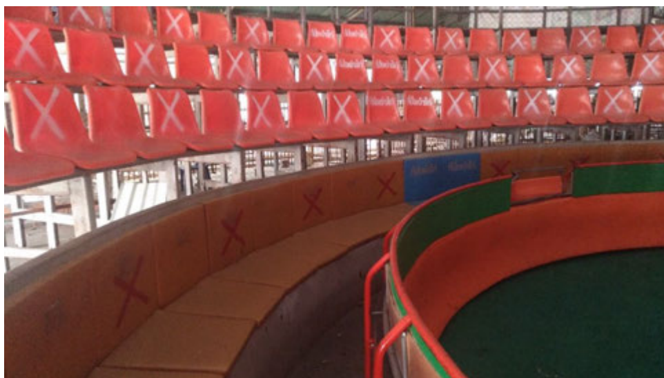
มาตรการระยะห่างในสังเวียน