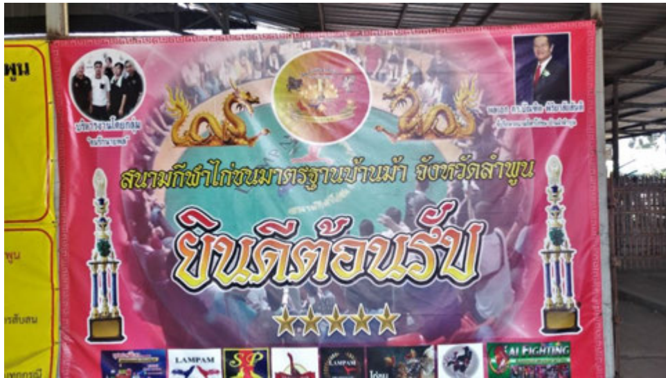
ป้ายสนามชนไก่บ้านม้า มีรูปนายพลเป็นที่ปรึกษา