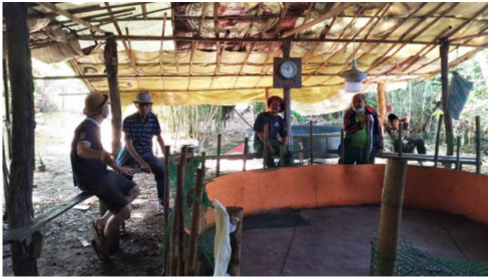
มาตรการระยะห่างในการเชียร์การชนไก่