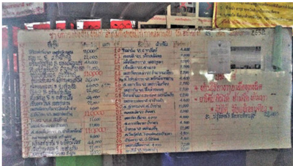
บอร์ดแสดงลำดับคู่ไก่ชนและจำนวนเงินเดิมพันแต่ละคู่