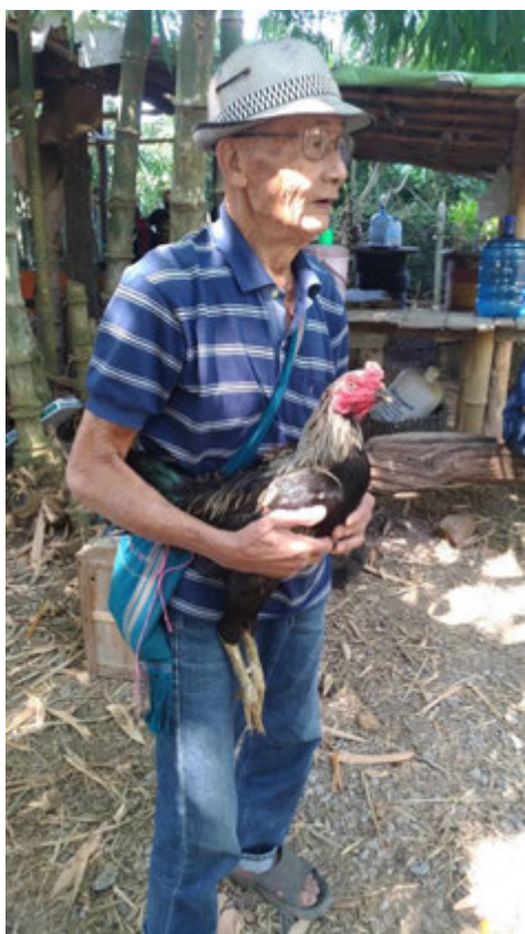
ภาพสนามซ้อมไก่ ของเครือข่ายผู้สูงอายุ