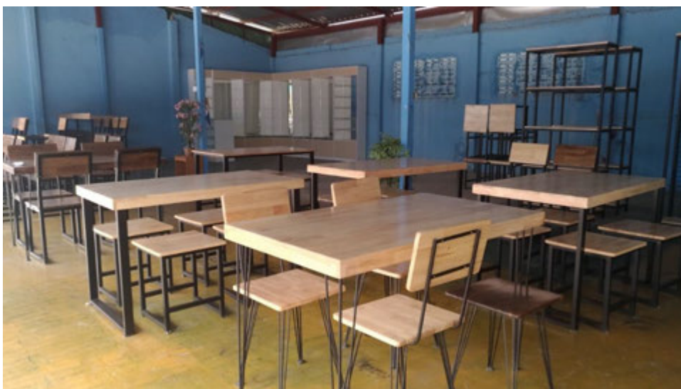
บ้านม้า ตำบลศรีบัวบาน อำเภอเมือง จังหวัดลำพูน ศูนย์กลางเฟอร์นิเจอร์ภาคเหนือ