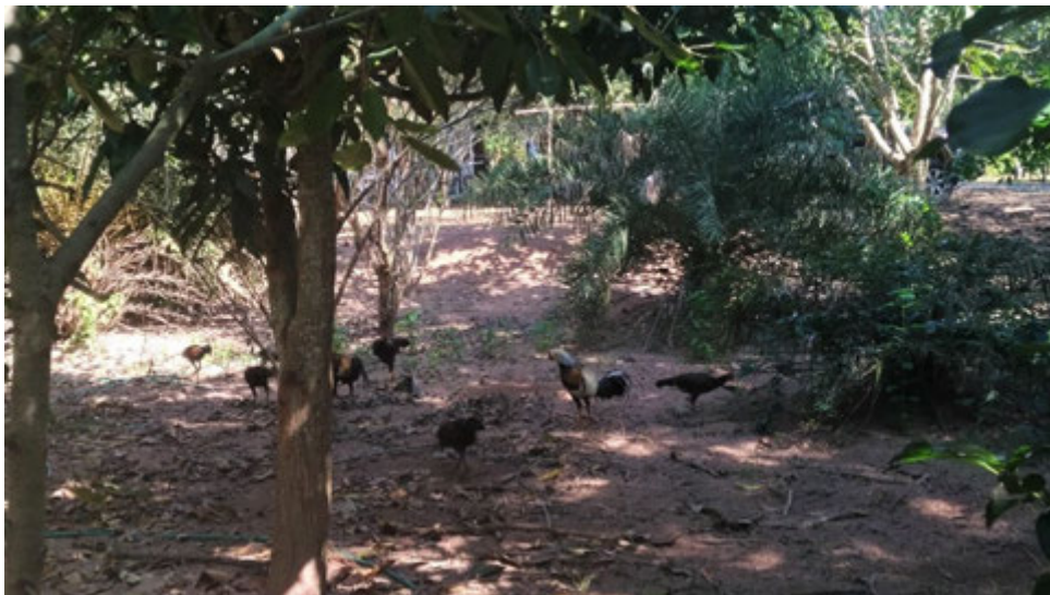
สถานที่ชนไก่นอกชุมชน