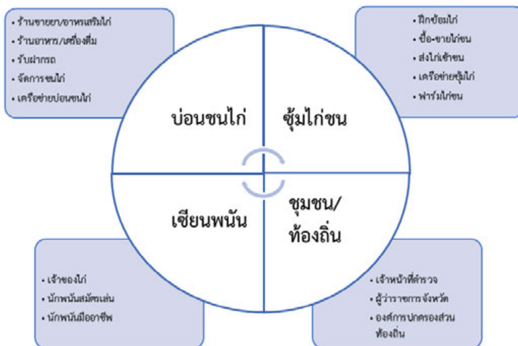
ภาพที่ 1 เครือข่ายการพนันชนไก่

หน่วยการวิเคราะห์ กรณีการศึกษาการพนันชนไก่ จะใช้บ่อนชนไก่เป็นหน่วยการ วิเคราะห์ เพราะบ่อนชนไก่เป็นเครือข่ายความสัมพันธ์ของกลุ่มคนที่เข้ามาเกี่ยวข้องทั้งในบ่อนและนอกบ่อนถึงองค์ประกอบ บทบาทหน้าที่ของแต่ละส่วน ไม่ว่าจะเป็นตัวบ่อนชนไก่ ชู้มไก่ ฟาร์มไก่ เซียนพนันชนไก่ และเห็นถึงความแตกต่างระดับความสัมพันธ์ระหว่างบ่อนกับ คน ชุมชน หน่วยงาน ราชการ