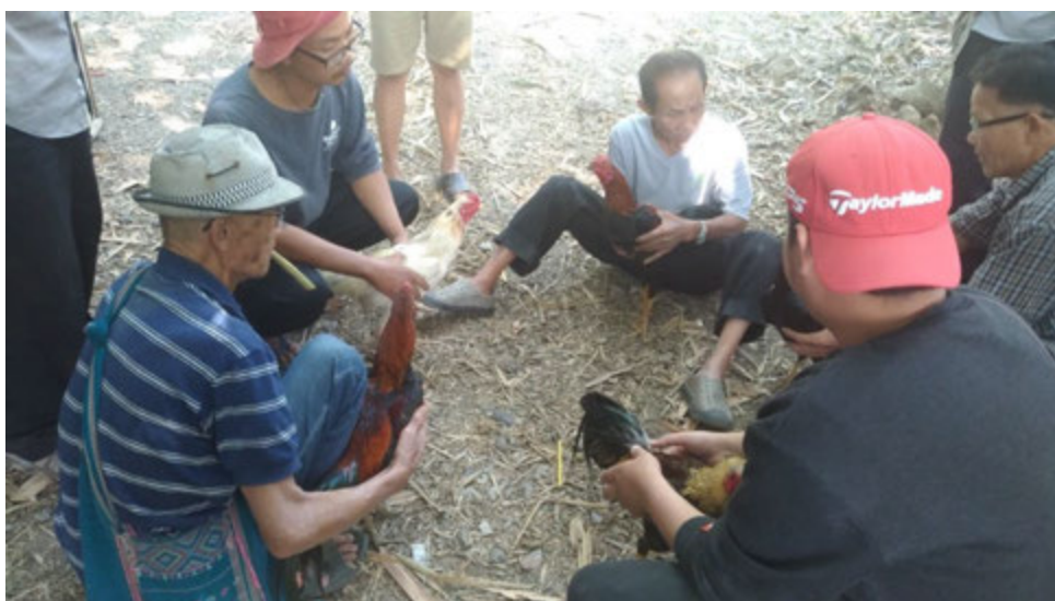
การประกบคู่ไก่ชน